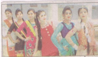
हरिभूमि न्यूज, होशंगाबाद