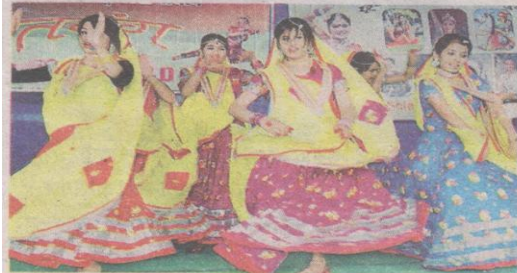
होशंगाबाद। सामूहिक नृत्य करते हुए छात्राएं।