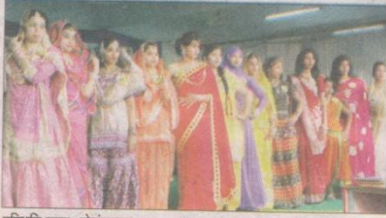
हरिभूमि न्यूज, होशंगाबाद

ग्लोस कॉलेज में चल रहे वार्षिक उत्सव के दूसरे दिन फैसी ड्रेस, नाटक एवं मिस शौर्या प्रतियोगिता हुई। इसमें सबसे ज्यादा आकर्षण मिस शौर्या प्रतियोगिता का रहा। इस प्रतियोगिता में 34 छात्राओं ने भाग लिया और क्षेत्रीय पारंपरिक परिधानों को पहनकर अपनी प्रस्तुति दी। प्रतियोगिता तीन चरणों में