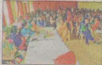
छात्राओं ने प्रश्न मंच में दिए सटीक जवाब।