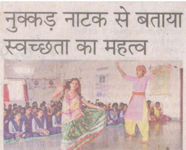
होशंगाबाद। एनएसएस कैम्प के समापन पर सांस्कृतिक कार्यक्रम की प्रस्तुति देती छात्राएं।