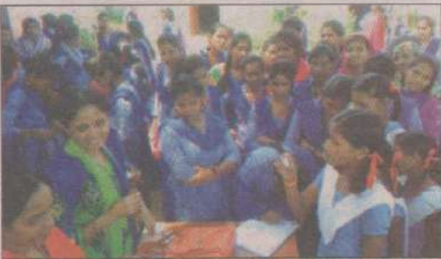
हरिमणि न्यूज ►► होशंगाबाद